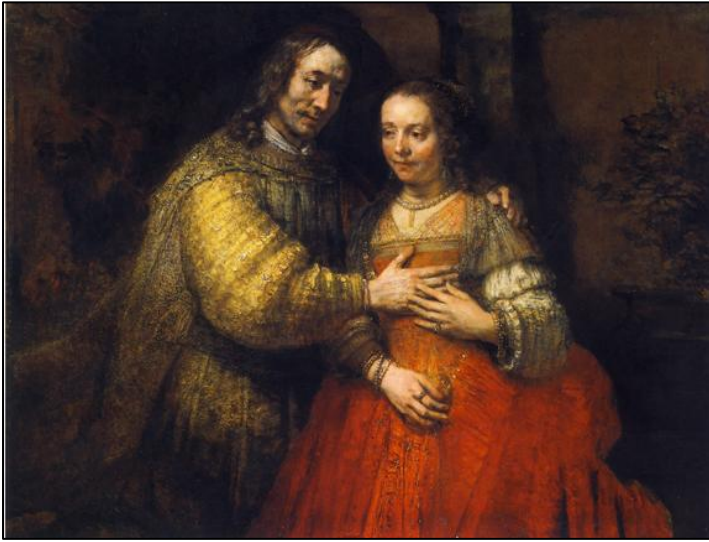
Jødebruden fra ca. 1666 af Rembrandt (1606-1669) er et af det verdensberømte Rijksmuseums mest gribende og bjergtagende malerier.

Den anden dag, hvor vi er i Amsterdam, vil vi besøge Rembrandts Hus , der nu er museum for hans enestående og store grafiske værk og desuden giver et godt indblik i et fornemt hus' indretning i 1600-tallet. Eftermiddagen sætter vi af til Van Gogh Museet , der ud over de fabelagtige samlinger af en af kunstens store koryfæer, også viser en særudstilling , der omhandler prostitution i billedkunsten i slutningen af 1800-tallet.