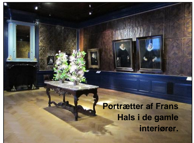
Portrætter af Frans Hals i de gamle interiører.

Fra Haarlem tager vi to af dagene den korte vej til Amsterdam , hvor rejsens hovedformål – det nyligt istandsatte og genåbnede nationalgalleri Rijksmuseum med mesterværkerne fra Hollands "gyldne århundrede" – 1600-tallet, skal nydes i fulde drag. Så den første Amsterdam-dag er sat af til de største: Frans Hals, Rembrandt og Vermeer van Delft og deres mange fremragende samtidige– og her må hver især afgøre, hvor meget tid man vil bruge på kunsten, og hvor meget tid man evt. vil anvende på at se nærmere på de smukke kanalkvarterer i nærheden.