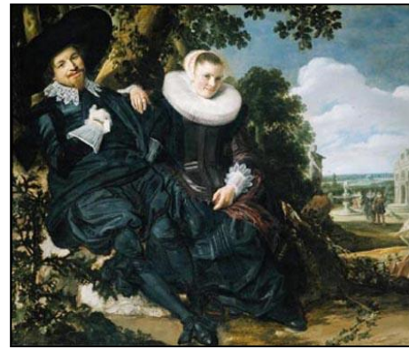
Frans Hals maleri fra Rijksmuseum