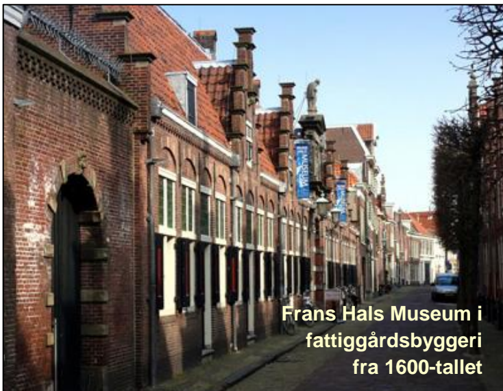
Frans Hals Museum i fattiggårdsbyggeri fra 1600-tallet

Frans Hals (1580-1666) lagde sit livsværk i Haarlem sammen med en hel skole af landskabsmalere.